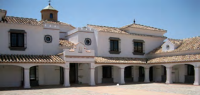
REFORMA Y AMPLIACIÓN DE CORTIJO CURIEL REFORM AND EXTENSION OF FARMHOUSE CURIEL ANTEQUERA