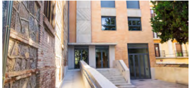
ESCUELA UNIVERSITARIA MARÍA INMACULADA MARIA INMACULADA UNIVERSITY SCHOOL ANTEQUERA