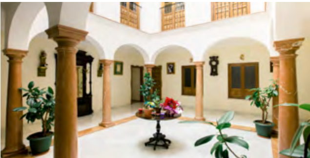
PATIO, RESTAURACIÓN CONVENTO MUSEO HNAS. CARMELITAS DESCALZAS PATIO, CONVENT RESTORATION MUSEUM CARMELITAS DESCALZAS' SISTERS ANTEQUERA