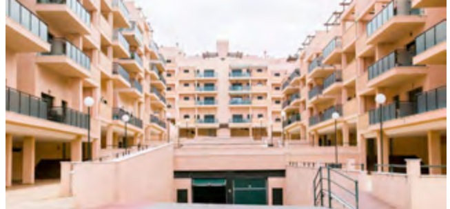
138 VIVIENDAS Y 32 LOCALES 138 HOMES AND 32 PREMISES ANTEQUERA