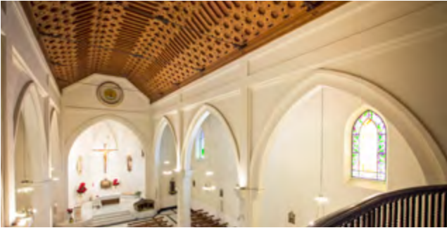
IGLESIA COLEGIO MARÍA INMACULADA MARIA INMACULADA'S CHURCH ANTEQUERA