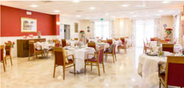
CAFETERÍA, RESIDENCIA DE MAYORES MADRE CARMEN CAFETERIA, MOTHER CARMEN'S HOME FOR THE ELDERLY MÁLAGA