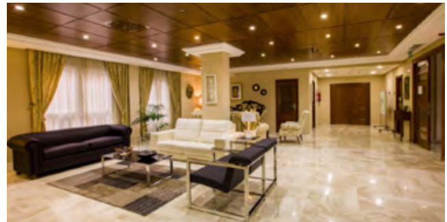
HALL ENTRADA, RESIDENCIA DE MAYORES MADRE CARMEN ENTRANCE HALL, RESIDENCE OF ELDERLY MOTHER CARMEN MÁLAGA