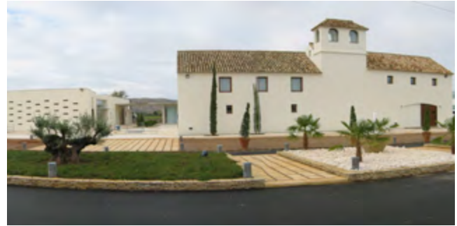
MUSEO Y OFICINAS DCOOP (Antigua Hojiblanca) MUSEUM AND OFFICES DCOOP (Old Hojiblanca) ANTEQUERA